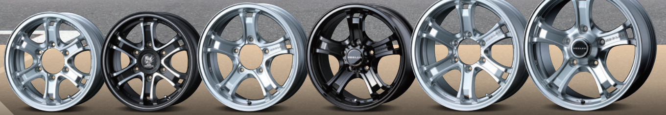
[HIACE] KEELER FORCE COLOR: MAT BLACK POLISH SIZE [FRONT / REAR] :15x6.0J INSET 33